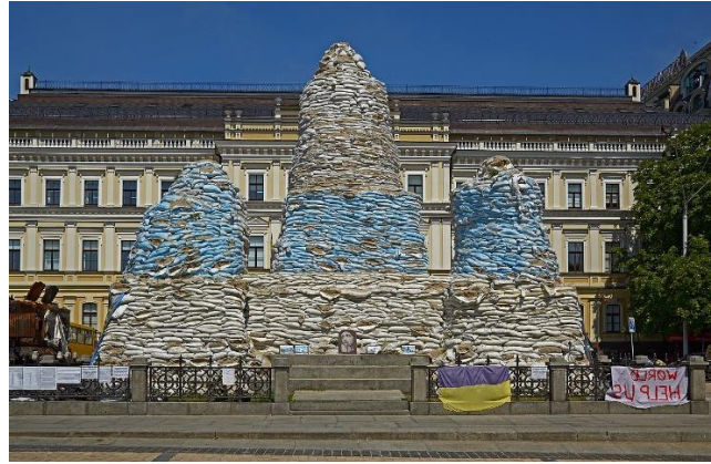
Рис. 2. Пам'ятник Княгині Ользі у липні 2022 р. [6]

Загалом новостворені підрозділи територіальної оборони міста Київ відіграли ключову роль в обороні столиці [1; 3; 5; 7]. Попри низький рівень забезпечення з боку держави, їм вдалось встояти та не дозволити реалізувати плани рф по захопленню столиці. Єдність народу – це сила, здатна протистояти найзапеклішим викликам. Проблема не до кінця сформованих підрозділів була оперативно вирішена рішуче налаштованим населенням, яке горою стало за Україну та її незалежність. Хоч напад рф був неочікуваним для українців, вони змогли згуртуватись, вистояти і показати усьому світу, своє свободолюбство, мужність та незламність. Військовою майстерністю України нині захоплюється значна частина світу.