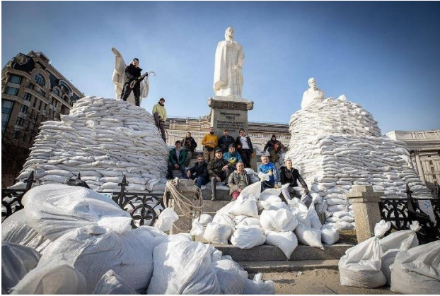
Рис. 1. Пам'ятник Княгині Ользі у березні 2022 р. [6]

приєднатись до сил територіальної оборони у Василькові, де розстріляли 14 добровольців та працівників Нацполіції. Це сталося 2 березня 2022 р., але все ж таки, після скоєного злочину, диверсанти були знешкоджені силами спецпідрозділу СБУ [2].